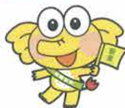
反射タスキを着装しているケロゾウくん