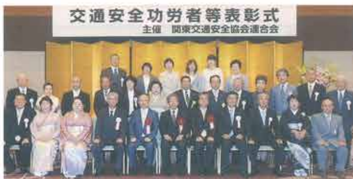
交通安全功労者等表彰式 主催 関東交通安全協会連合会