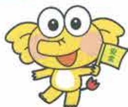
横断旗を持つケロゾウくん