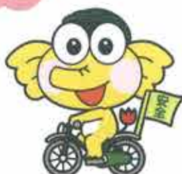
自転車乗車中のケロゾウくん