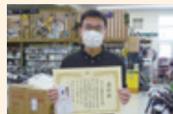
ジョイフル本田古河店