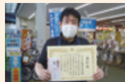
ジョイフル本田守谷店