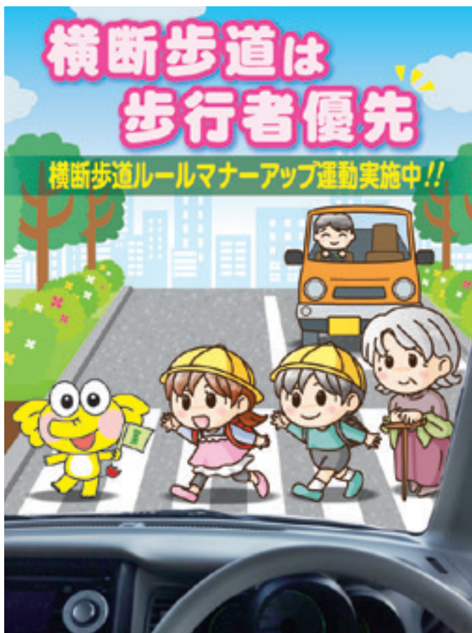
茨城県交通安全協会・茨城県・茨城県警察