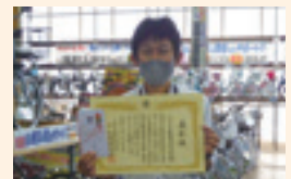
ジョイフル本田荒川沖店