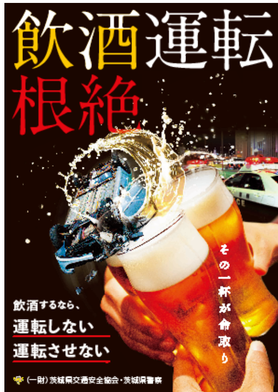
飲酒運転根絶ポスター