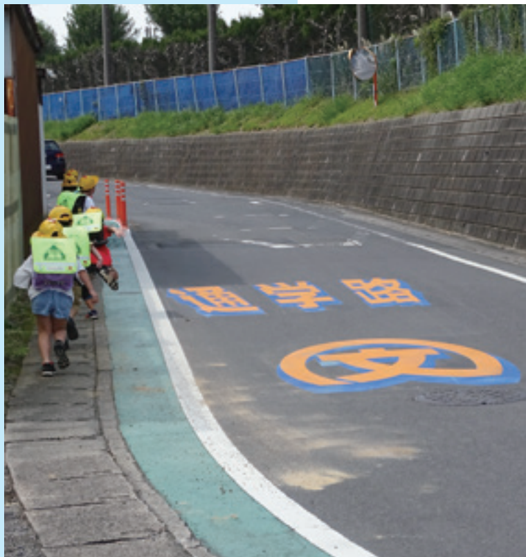
通学路強調シート

一般財団法人 茨城県交通安全協会(茨城県交通安全活動推進センター) 曾雌 哲雄 〒310-0846 水戸市東野町260番地 TEL 029(247)3355(代表) FAX 029(247)3357 http://www.ibaankyo.or.jp