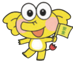
協会キャラクター ケロゾウくん®