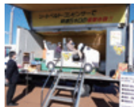
シートベルト効果体験車の実施状況

筑西地区交通安全協会・筑西市・筑西警察署・母の会等が主体となり、「道の駅グランテラス筑西」において新鮮な気持ち（餅）キャンペーンを開催し、おしるこ等の啓発品の配布やシートベルトの重要性を呼びかけた。