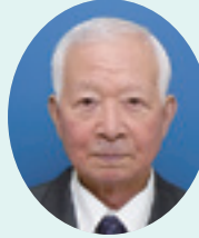
筑西地区 比氣 斌弘