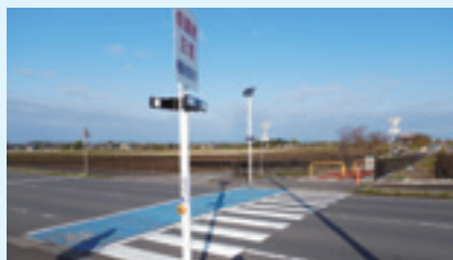
②土浦市高岡 （県道×つくば霞ヶ浦りんりんロード）