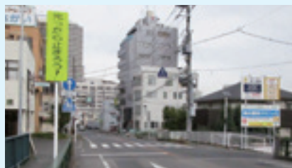
①土浦市桜町1丁目（国道125号市道）