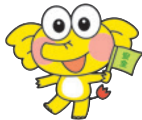
協会キャラクター ケロゾウくん®