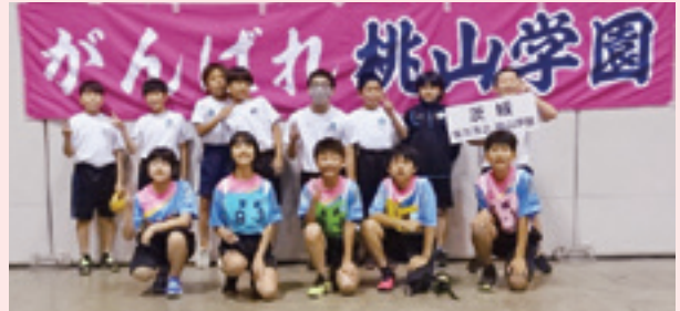
桃山学園選手の皆さん