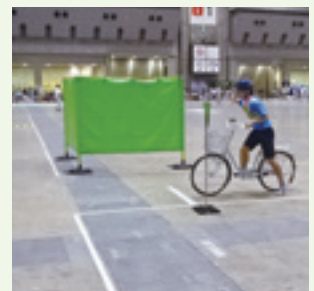
信号機のない交差点の右折